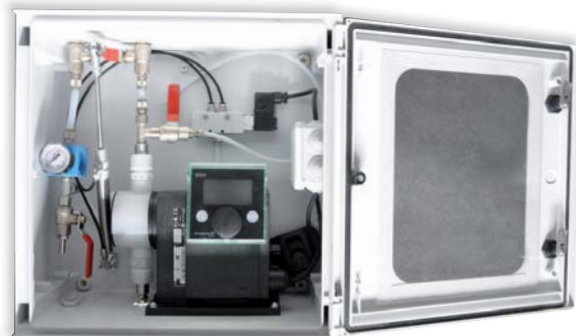
Pompe Auto NA / DDA