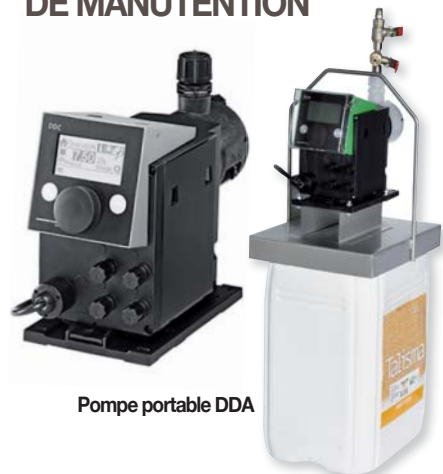
Pompe portable DDA

TOUS TYPES DE MATÉRIEL ADAPTÉ AU DÉBIT DE MANUTENTION