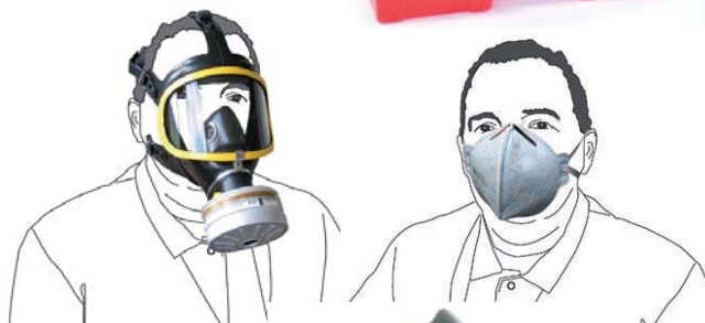
Masques et gants