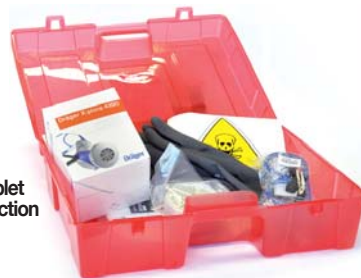
Kit complet de protection